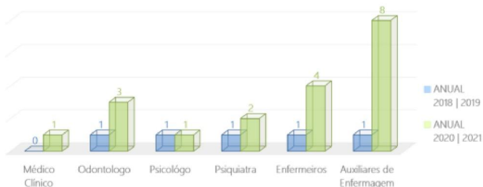
GRÁFICO 2: QUANTIDADE DE PROFISSIONAIS DE SAÚDE NA PAMC PROFISSIONAIS DA SAÚDE

Fonte: CONSELHO NACIONAL DO MINISTÉRIO PÚBLICO 7